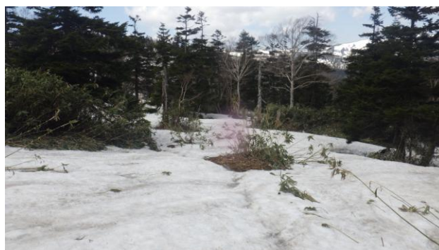
(犬倉分岐から三ツ石方面登山道)