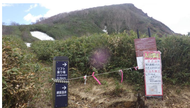
(犬倉分岐の入山規制看板)