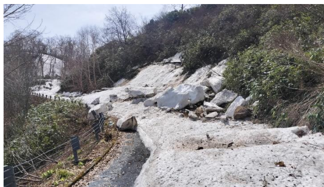
(奥産道ゲート付近)