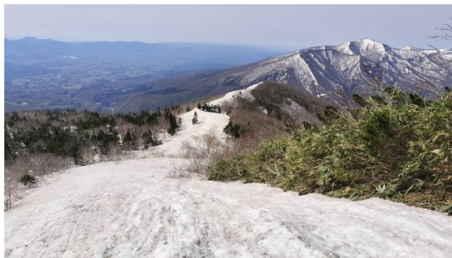
(小松倉山へ向かう尾根)