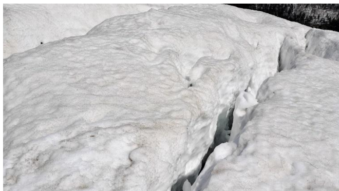
(大松倉山山頂付近北側斜面クラック)