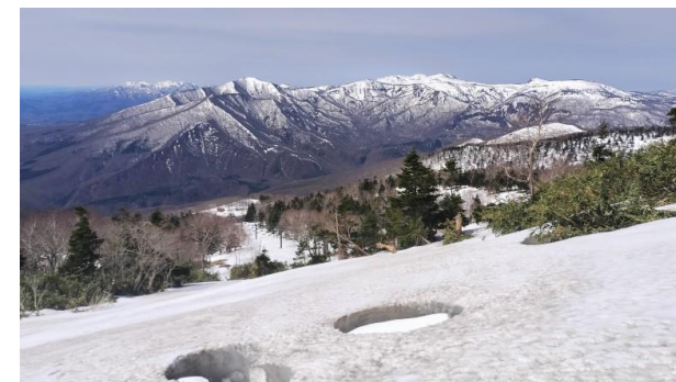
(第3リフト降り場階段上)