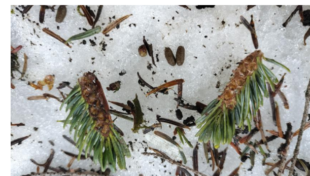
(モモンガの食痕とフン)