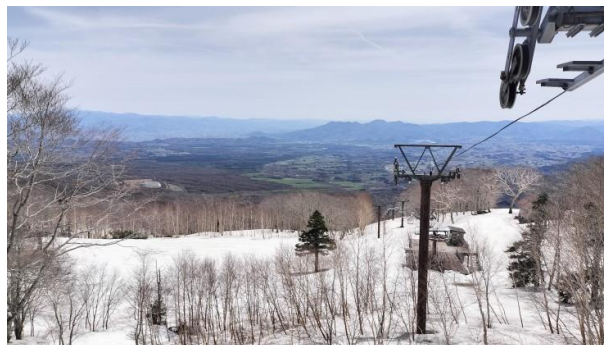
(第2リフトB線降り場より)