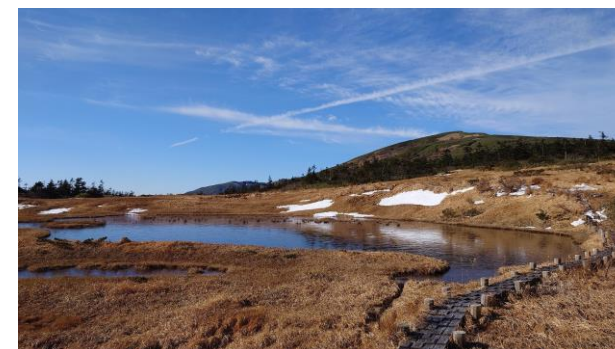
(氷の張った池塘と笹森山)