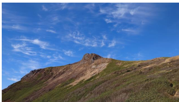
(秋田駒ヶ岳縦走路からの烏帽子岳)