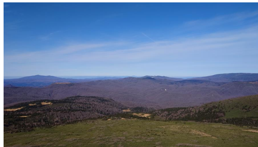
(烏帽子岳山頂からの森吉山、岩木山、秋田焼山、八幡平)