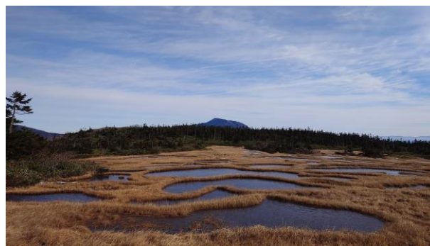
(千沼ヶ原と岩手山)