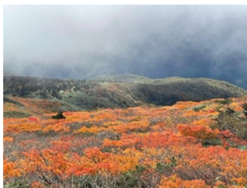
(山頂から源太ヶ岳方面)