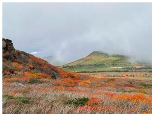
(三ッ石山山頂・小畚山方面)