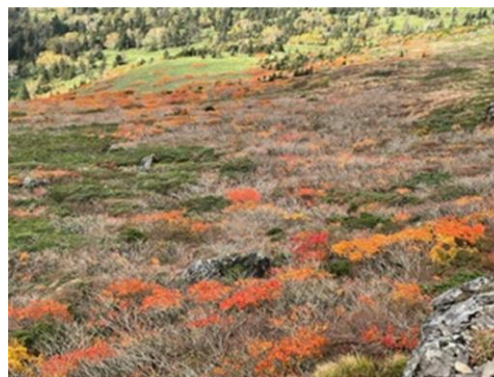
(山頂から北側斜面)