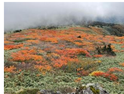
(山頂から北側斜面)