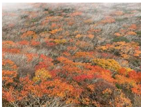
(山頂から北側斜面)