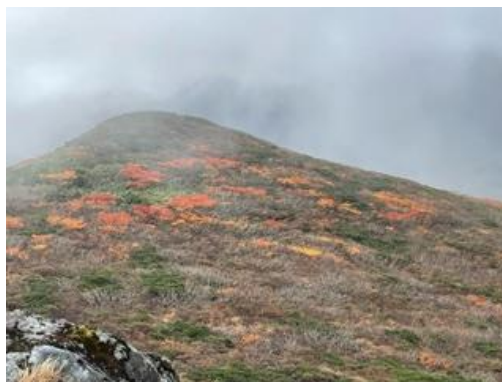
(山頂から烏帽子岳方面)