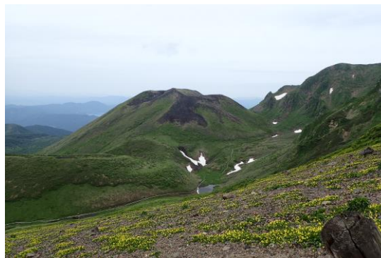
(大焼砂から女岳方面)