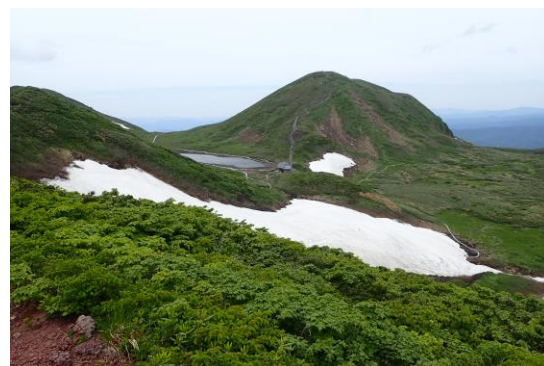
(横岳より阿弥陀池方面)