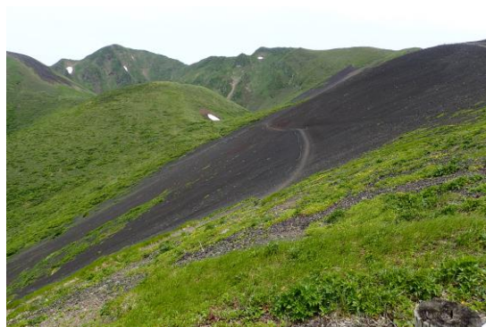
(大焼砂からムーミン谷方面)