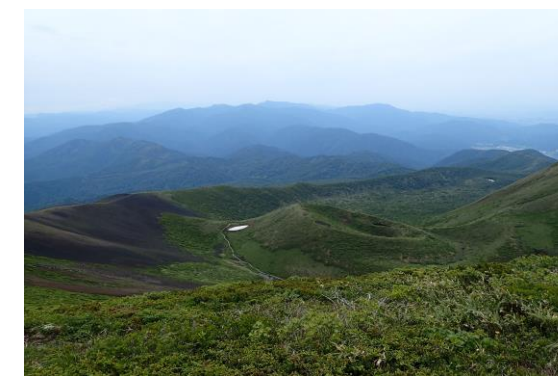
(横岳より小岳方面)