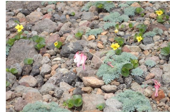
(コマクサとタカネスミレ)