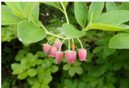
(ガクウラジロヨウラク)