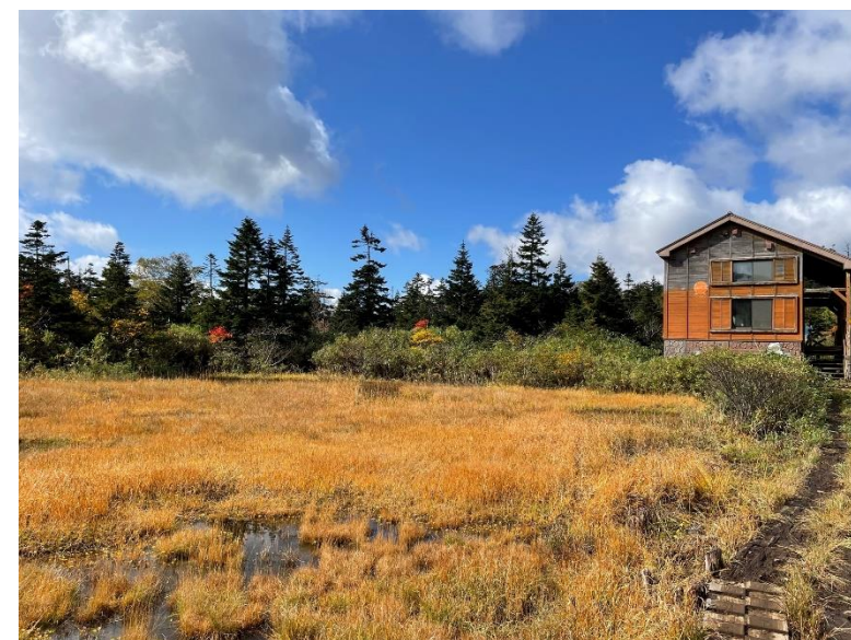
（三ッ石山荘と三ッ石湿原）