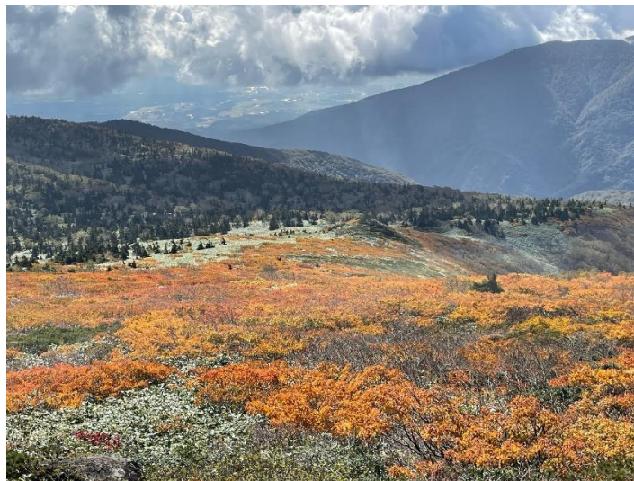
（三ッ石山山頂より北側斜面）