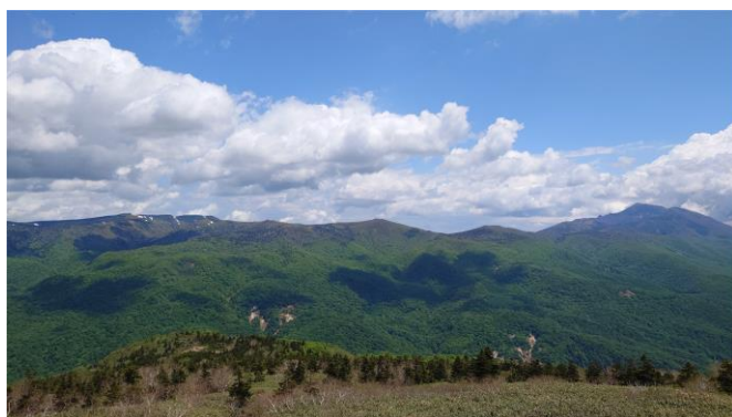
（雪渓上部から三ッ石山、岩手山方面）