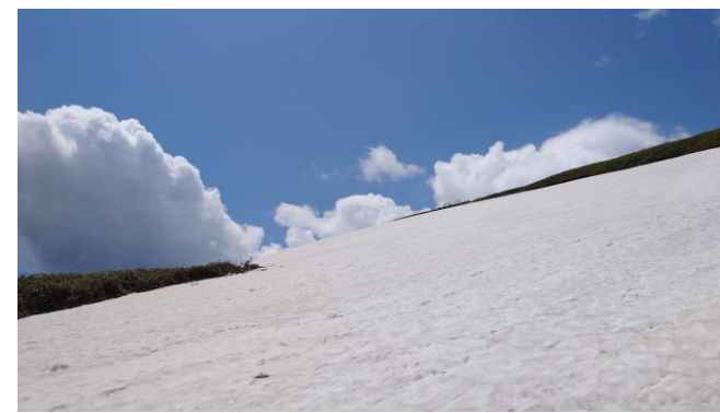
（小乳頭の雪渓） 転倒や登山道の見失い注意！