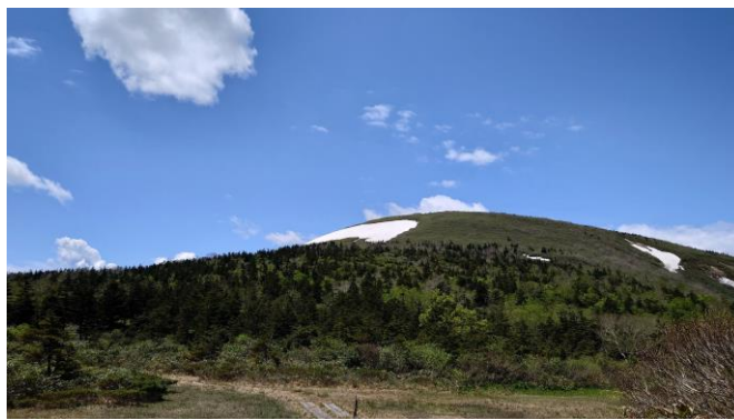
（小湿原から小乳頭）