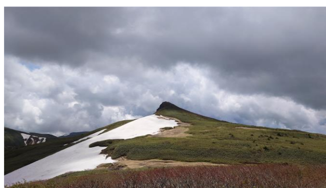
（烏帽子岳直下の雪渓） 転倒や登山道の見失い注意！