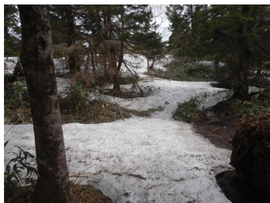
(山荘手前、残雪による登山道の見失い 注意 )