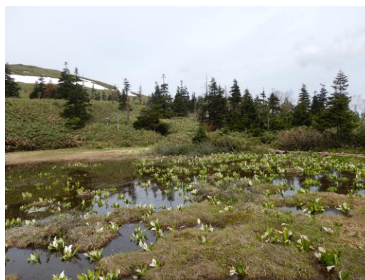
(三ッ石山荘前の池塘のミズバショウ)