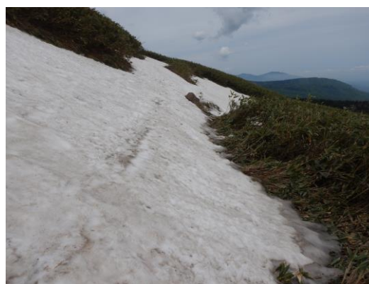
(山頂にかけてまとまった残雪あり、 転倒注意 )