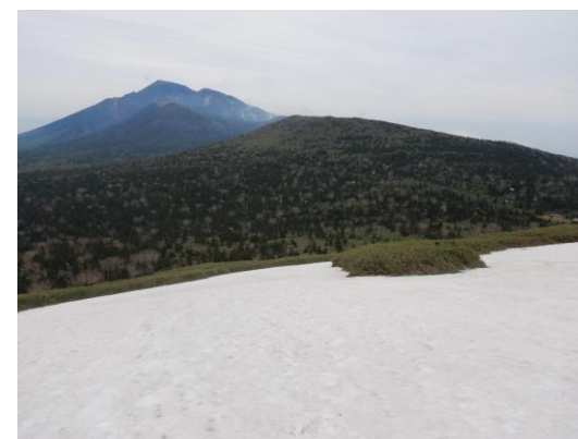
(岩手山・大松倉山方面、 転倒注意 )