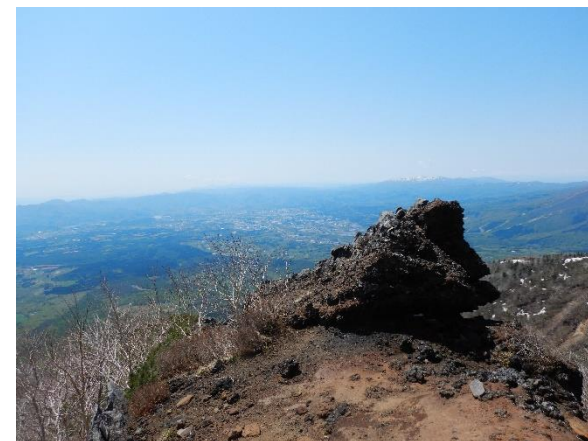
(笠締から見た和賀山塊方面)