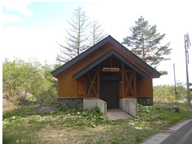
(登山口のトイレは使用できません)