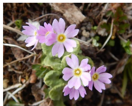
(ユキワリコザクラ)