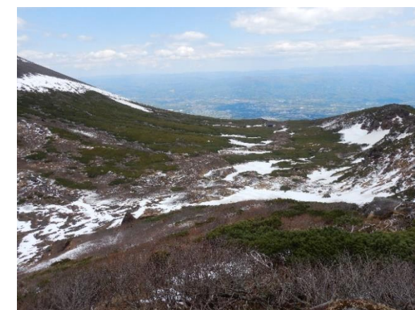
(八合目避難小屋方面)