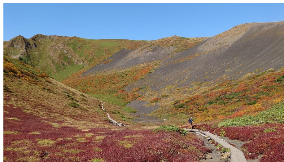
(馬場の小路のチングルマ紅葉)