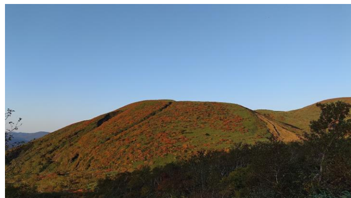
(八合目から笹森山)