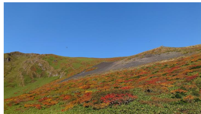
(馬場の小路から大焼砂)