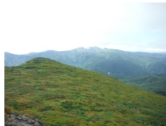
(三ッ石山山頂周辺から、後ろに烏帽子岳)