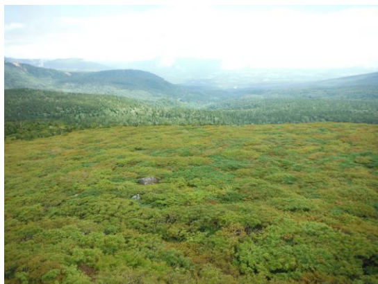
(ほんのり色付き始めた三ッ石山の山腹)