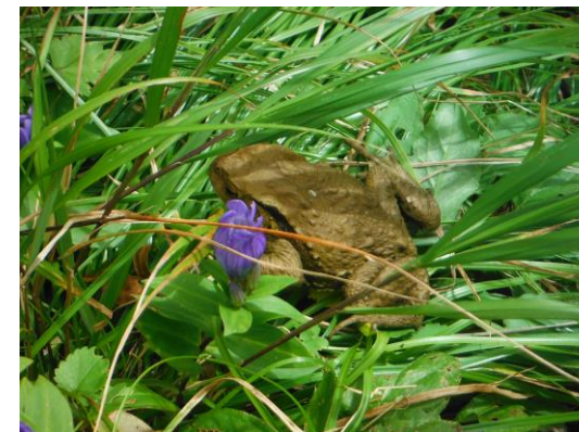
(アズマヒキガエル)