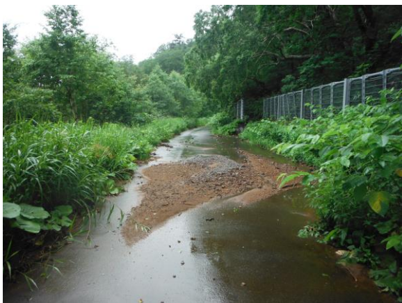
2022年7月23日の大雨で荒れた奥産道の様子