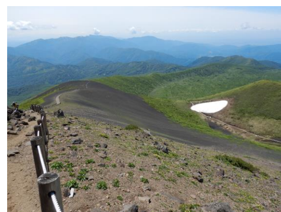
(横岳周辺から見た大焼砂と小岳)