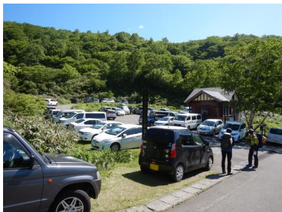
(国見温泉の駐車場)