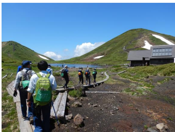
(阿弥陀池と男女岳、阿弥陀池小屋)