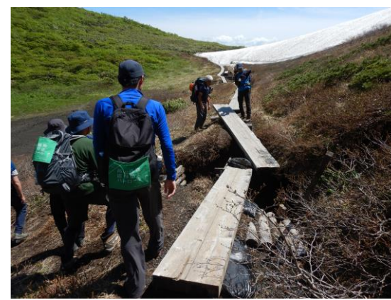
(小岳周辺、木道の一部に破損)