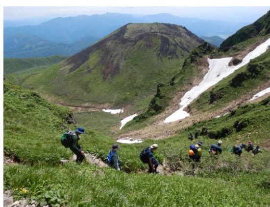
(男岳分岐から見た女岳)