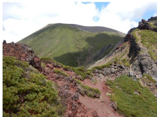
(鬼ヶ城から見た薬師岳)