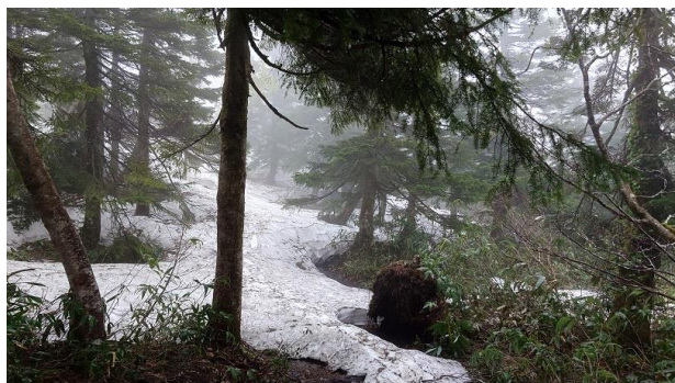
(大松倉周辺の様子)