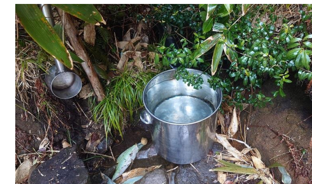
(三ッ石山荘の水場の様子)