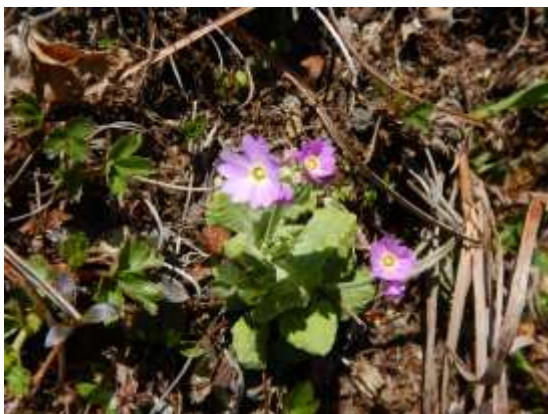
(笠締め付近のユキワリコザクラ)