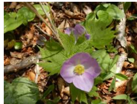
(切接付近のシラネアオイ)