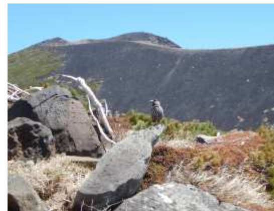
(鬼ヶ城分岐にてホシガラス)