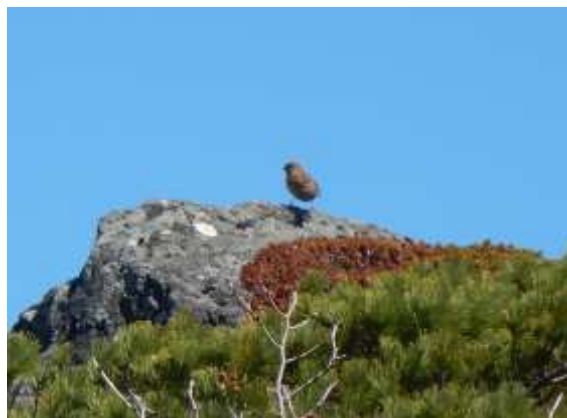
(ハイマツ帯でカヤクグリ)