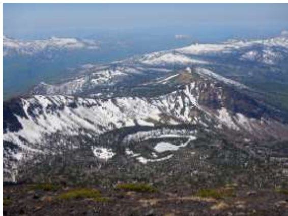
(山頂付近から御苗代湖や鬼ヶ城)