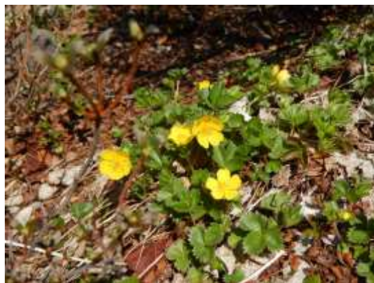
(笠締め付近のミヤマキンバイ)