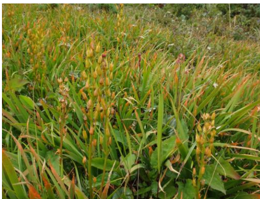
(鬼ヶ城・キンコウカの紅葉)