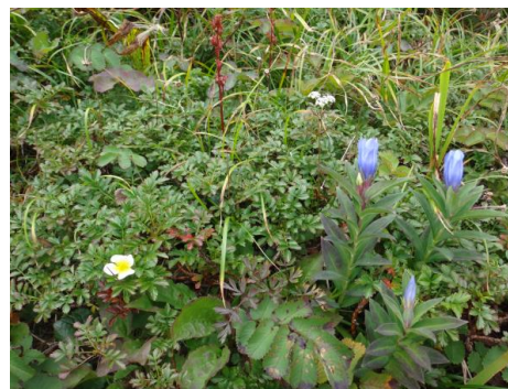
(チングルマとエゾオヤマリンドウ)