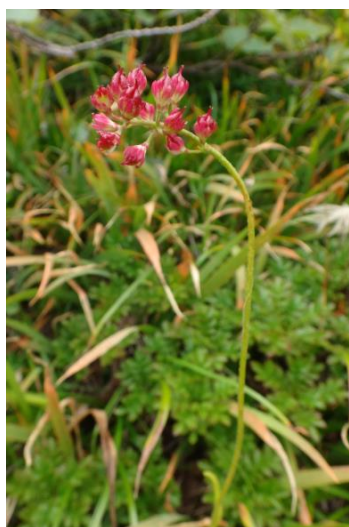
(イワショウブの実)