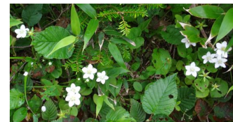
(ウメバチソウ群落)