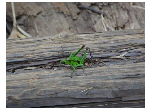
(ハヤチネフキバッタの産卵)