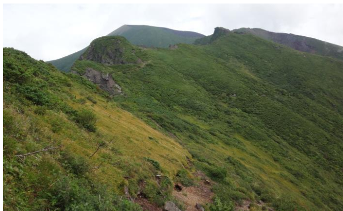
(鬼ヶ城・草紅葉の始まり)