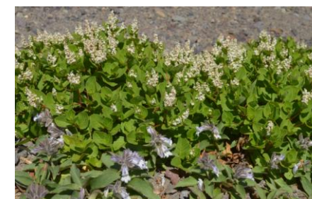
(オヤマソバとイワブクロ)