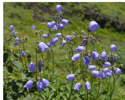
(ハクサンシャジン)