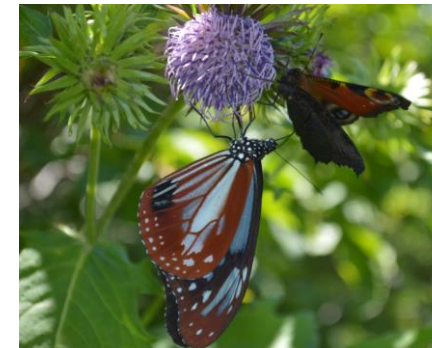
(アサギマダラとクジャクチョウ)