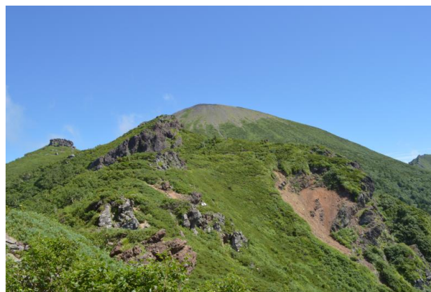
(屏風尾根三峰付近から見た岩手山山頂)