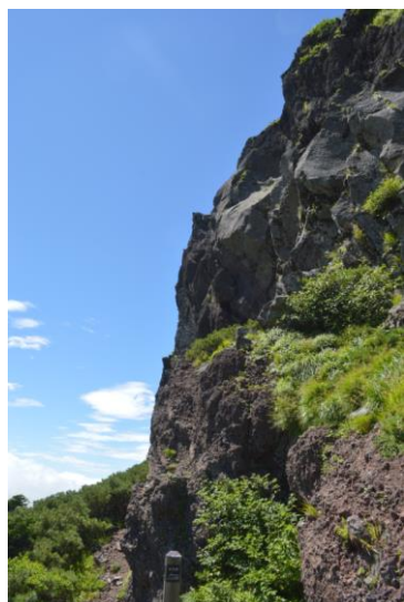
(屏風三峰直下道標)

◎コース：網張～鬼ヶ城～岩手山山頂～屏風尾根～お花畑～大地獄～網張 ◎コース状況：平笠不動避難小屋から屏風尾根の登山道はいつされたかわからないが若干刈払いされており、プチ藪漕ぎ。またピンクテープ目印もある。ただ箇所箇所によっては注意しないとピンクテープ見落とす危険あり。屏風尾根の三峰の道標から急坂を下っていくが、急坂を下る登山道から約25分下ったところにある道標まではやや藪漕ぎ（笹ではない）。ここも1年か数年に1回は刈払いしている様子。ピンクテープは結構細かくあったので、ここもそれを見落とさないように進む。上記道標からお花畑まではやや歩きやすくなるが、箇所箇所でも藪漕ぎあり。