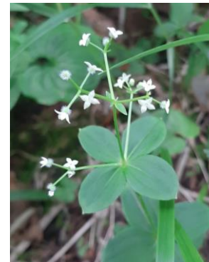
(オオバノヨツバムグラ)

網張～姥倉～黒倉周辺 (7/20): オオバギボウシ、クルマユリ、シロバナトウチソウ、オオバノヨツバムグラ、ミヤマコウソリナ、キオン、イブキゼリモドキ、アマニュウ、エゾノヨロイグサ、ハクサンボウフウ (群落)、オトギリソウなど