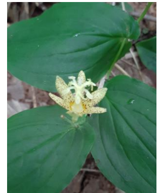
(タマガワホトトギス)