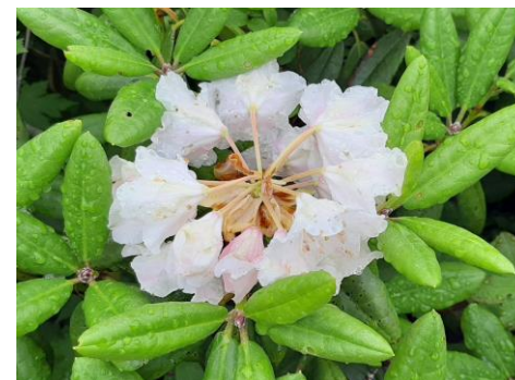
(ハクサンシャクナゲ)