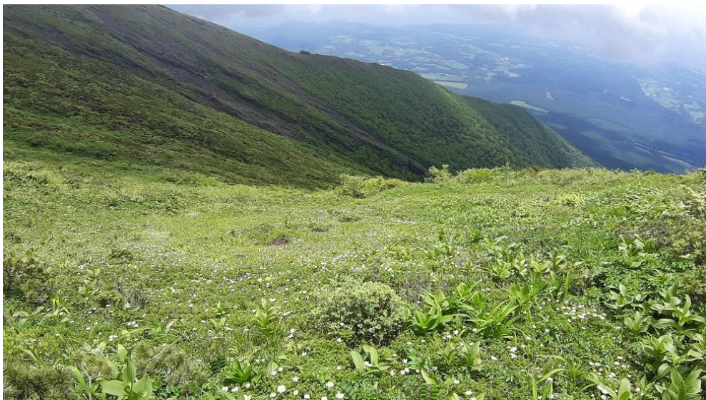
(鬼ヶ城からの眺め)