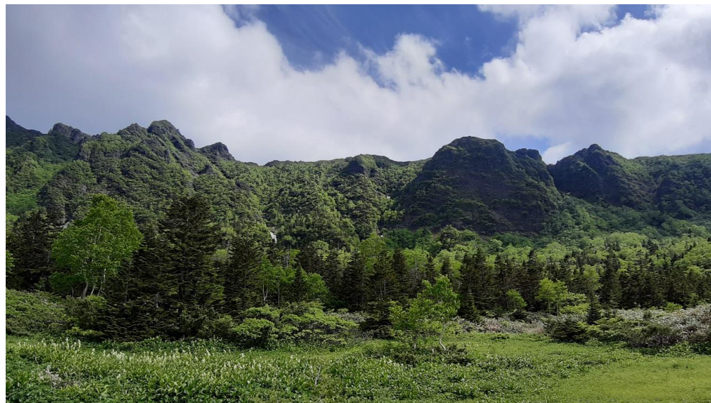
(お花畑からの眺め)