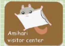
Amihari visitor center ニュースレター100号記念・ 四代目 (2022年)

2015年、転機が訪れました。滝沢市の鞍掛山で行われたスノーシュー行事の最中、大勢の参加者の目の前で木を登ると登る小さな灰色の姿が! 梢の先で止まってこちらを見ろす大きな眼、そして滑空。まちがいに「モモンガ」です。通常は、夜間のみ活動するはずですが、朝から雪が降り続いて日中でも薄暗かったので、うっかり出てきてしまったのでしょうか。この出会いをきっかけに、網張の森でも「モモンガ」の姿を確認しようとする試みがスタートしました。