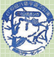
全国自然いきもの スタンプラリー (2010年)