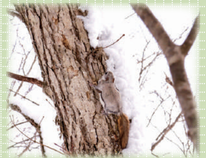
鞍掛山で撮影されたモモンガ (2015年)