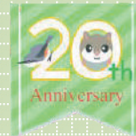
網張 VC 開設 20周年記念 (2024年)