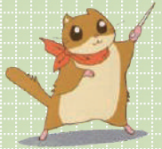
VCパンフレット・ 二代目 (2007年)