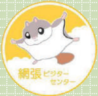
国立公園 60周年記念 横断幕・三代目 (2016年)