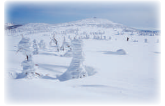
（晴れた日 Mitsushima山方面を望む）

もう一つは、裏岩手の縦走です。八幡平から岩手山へと続くルートは、変化に富んだ地形と雄大な景観が魅力です。仲間と共に雪原を進み、時に笑い合い、時に励まし合いながら歩いた時間は、かけがえのない記憶となっています。特に、爆弾低気圧に当たり三ツ石山荘で3日間の停滞を余儀なくされ、予備食もほぼ底をついた中で網張スキー場に着いた瞬間は、今でも鮮明に思い出されます。