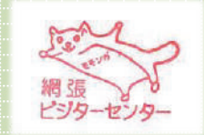
網張 ビジターセンター

おまけに本州から九州で見られる「ニホンモモンガ」は、人里近くにも棲み生態も良く知られている北海道の「エゾモモンガ」とは別種で、その詳しい生態はほとんど分かっていません。そんな「ニホンモモンガ」が、どうして網張ビジターセンターのシンボリックなマスコットになったのでしょうか?