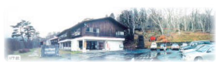
（写真2 岩手山麓国民休暇村「網張温泉館」の名称で改装 撮影は平成7年秋）