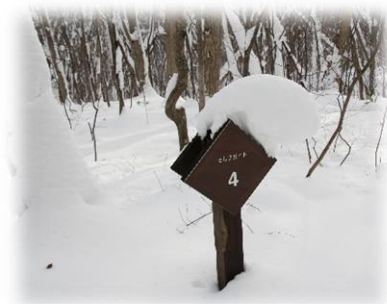
セルフガイドの道標