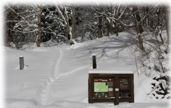
ビジターセンターから薬師社へ続く園路