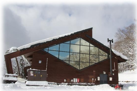
ガラスに映った景色にも注目！