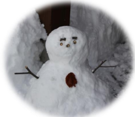
雪だるまさん登場