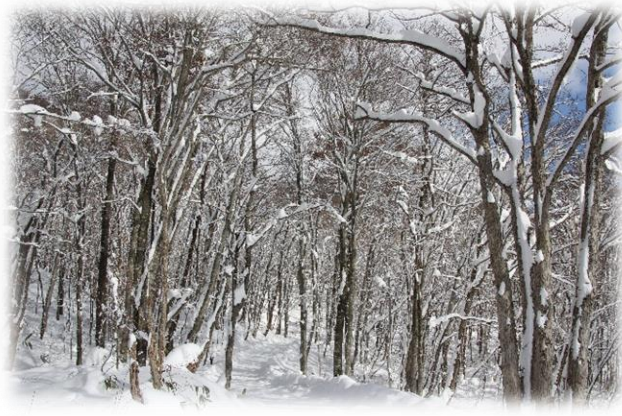
キャンプ場へ続く園路