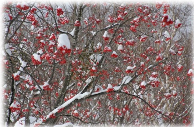
ナナカマド (バラ科)