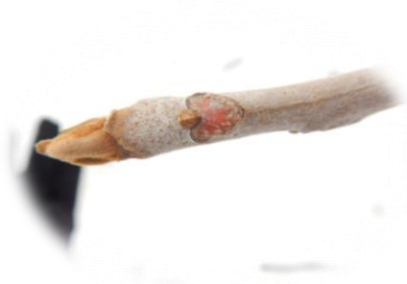
ヤマウルシ（ウルシ科）