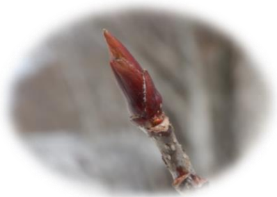
アズキナシ（バラ科）