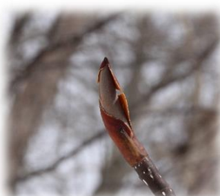
ホオノキ（モクレン科）