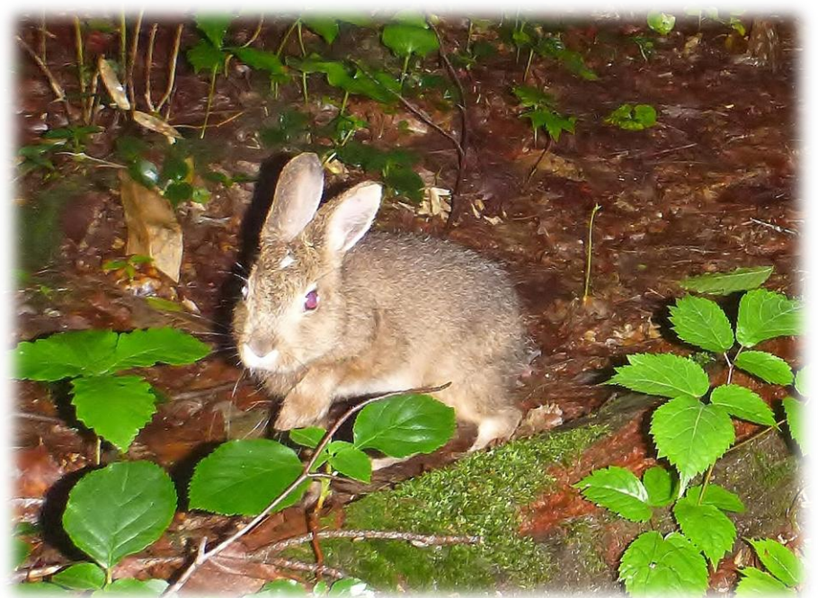
「トウホクノウサギ」

厳しい冬を乗り越えて鋭いまなざしを向けるキツネや、カメラを発見したタヌキのユーモラスな姿に加え、普段は目にすることがほとんどないトラツグミ等、希少な写真も展示致します。十和田八幡平国立公園に広がる網張の森が持つ豊かな自然を、本展示を通して身近に感じ取っていただけたら幸いです。