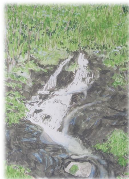
早池峰山途中の滝 「清廉の滝」